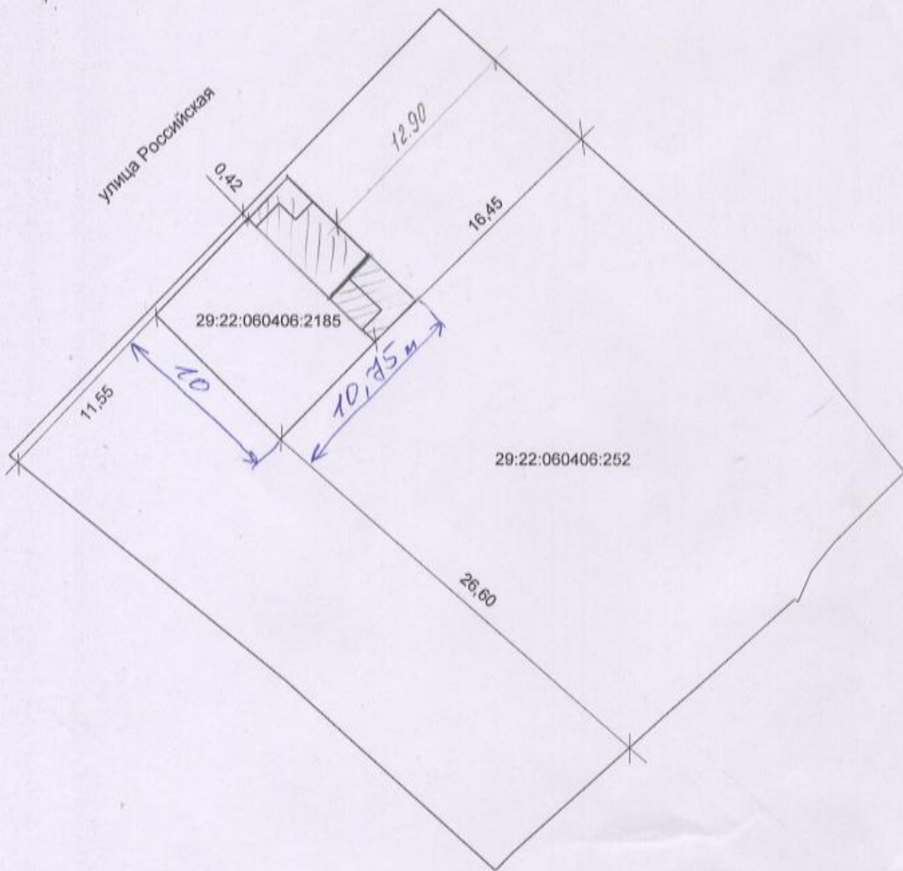
Схема расположения земельного участка